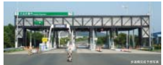
歩道橋完成予想写真